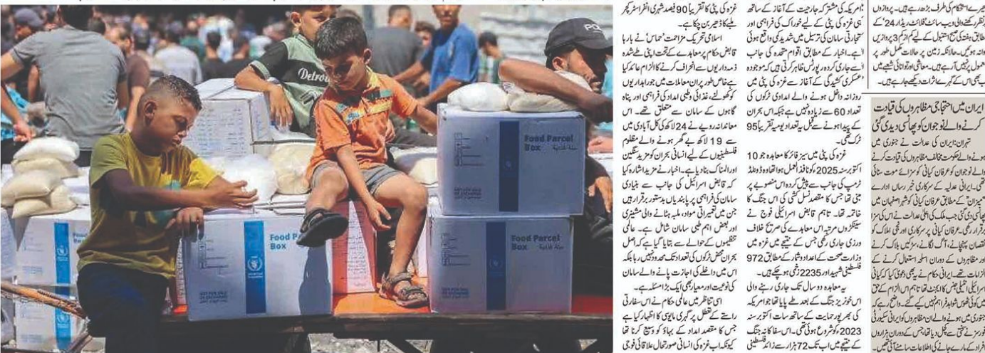
غزہ کی پٹی میں انسانی امداد کی فراہمی میں شدید کمی... علاقائی کشیدگی میں اضافے کے باعث غزہ کی پٹی میں انسانی امداد کی فراہمی میں شدید کمی۔