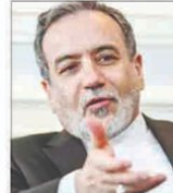
عراقی وزیر خارجہ محمد عراقی

واشنگٹن کے دوران جبکہ عراقی وفد کے ساتھ امریکی وفد کے دورے کیلئے پاکستان سے ایرانی وزیر خارجہ کا وفد بھی منسوخ ہو گیا ہے۔