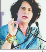
پریزنگ نے کہا کہ بی جے پی کی حکومت میں اب متاثرہ کو ہراساں کرنے کا نیا نظام بن گیا ہے۔

نئی دہلی (یو این آئی)۔ بی جے پی کی حکومت میں اب متاثرہ کو ہراساں کرنے کا نیا نظام بن گیا ہے۔ پریزنگ نے کہا کہ بی جے پی کی حکومت میں اب متاثرہ کو ہراساں کرنے کا نیا نظام بن گیا ہے۔ پریزنگ نے کہا کہ بی جے پی کی حکومت میں اب متاثرہ کو ہراساں کرنے کا نیا نظام بن گیا ہے۔ پریزنگ نے کہا کہ بی جے پی کی حکومت میں اب متاثرہ کو ہراساں کرنے کا نیا نظام بن گیا ہے۔