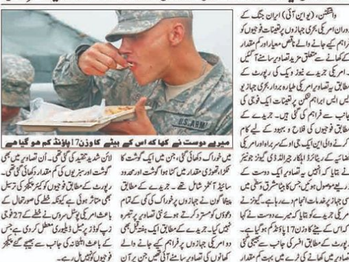
میریلین ڈوسٹ خور کھا کھا کہ اسے ہفتہ کا وزن 1 پونڈ تک کم ہو گیا ہے...