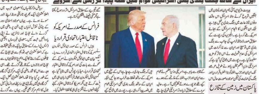
ایران کے ساتھ جنگ بندی بھی اسرائیلی عوام میں غصہ پیدا کر رہی ہے: اسرائیل...