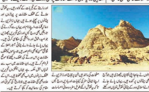
ایران کے تھریس کے عجیب و غریب نقوش اور تھریس، عاز مین حج کے طویل اور روحانی سفر کی گواہ...