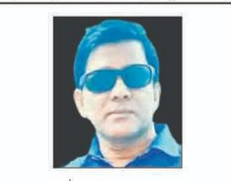
ایم بی خالد بنی دہلی

یہ ناول شاعر نے اپنے لفظ کو اس کے معنی سے دور کرنا شروع کیا ہے۔ اس میں ایک طرح کی خود آسانی ہے۔ وہ ہاتھ سے انسانی ہمدردی میں اس کی انشاد کا مجموعہ بنا ہے۔ یہی شعروں کے بیان کو بولنے کی حکمت ہے۔