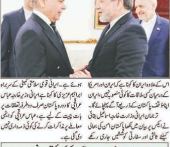
ایرانی وزیر خارجہ عباس ارغچی اور پاکستانی وزیر خارجہ بیل راز خان

دو دنوں تک جاری رہنے والے ورکنگ سیشن مکمل... ایرانی وزیر خارجہ کے دورہ اسلام آباد کا پہلا اہم ورکنگ سیشن مکمل۔