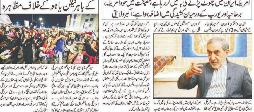
ایران کے خلاف سیمسہ پلائی ہوئی دیوار ہے۔ فرینک ایچ ایچ...