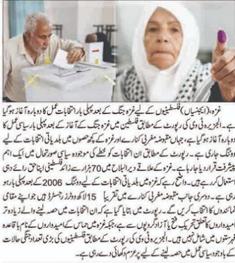
غزہ (پکیسٹان) فلسطین کے لیے نئے جنگ کے بعد پہلی بار انتخابات عمل کا دوبارہ آغاز ہو گیا ہے۔

فلسطین میں غزہ جنگ کے بعد پہلی بار انتخابات عمل کا دوبارہ آغاز ہو گیا ہے۔ اس وقت فلسطین میں غزہ جنگ کے بعد پہلی بار انتخابات عمل کا دوبارہ آغاز ہو گیا ہے۔