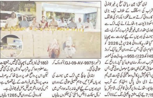
نوی مہینے پولیس نے ایک ٹرک سمیت ایک کروڑ 45 لاکھ روپے مالیت کی شراب ضبط کی، دو افراد گرفتار۔

نوی مہینے پولیس نے ایک ٹرک سمیت ایک کروڑ 45 لاکھ روپے مالیت کی شراب ضبط کی، دو افراد گرفتار۔ نوی مہینے پولیس نے ایک ٹرک سمیت ایک کروڑ 45 لاکھ روپے مالیت کی شراب ضبط کی، دو افراد گرفتار۔ نوی مہینے پولیس نے ایک ٹرک سمیت ایک کروڑ 45 لاکھ روپے مالیت کی شراب ضبط کی، دو افراد گرفتار۔