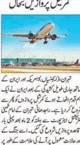
ایران نے پھر شروع کردی جوصلے کی اڑان

ایران نے پھر شروع کردی جوصلے کی اڑان... جنگ کے 2 ماہ بعد نظر آئی امید کی کرن بہرائی میں کمرشل پروازیں بحال۔