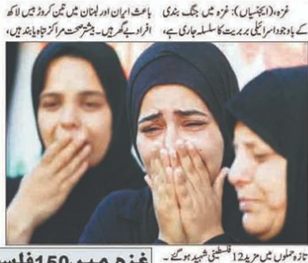
غزہ میں جنگ بندی کے باوجود اسرائیلی حملے، 12 فلسطینی شہید

غزہ میں جنگ بندی کے باوجود اسرائیلی حملے، 12 فلسطینی شہید... اسرائیلی قابض فورسز کی جانب سے مسجد الاقصیٰ اور عیسائی مقدس مقامات کی بار بار خلاف ورزیوں کی 8 ممالک کی شدید مذمت۔