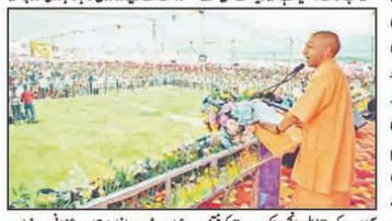
یوگی بھوپالی نے بنگال میں اپنی حکومت کے دوران ترمیم شدہ قانون (بی جے پی) کی پختگی کا اعلان کیا۔

انڈیا (یو این آئی)۔ اتر پردیش کے وزیر اعلیٰ یوگی بھوپالی نے مغربی بنگال میں اپنی حکومت کے دوران ترمیم شدہ قانون (بی جے پی) کی پختگی کا اعلان کیا۔ انہوں نے کہا کہ اس قانون کو نافذ کرنے کے بعد بنگال میں ہندوؤں کی تعداد میں اضافہ ہوگا۔ یوگی بھوپالی نے کہا کہ انہوں نے بنگال میں اپنی حکومت کے دوران ترمیم شدہ قانون (بی جے پی) کی پختگی کا اعلان کیا۔ انہوں نے کہا کہ اس قانون کو نافذ کرنے کے بعد بنگال میں ہندوؤں کی تعداد میں اضافہ ہوگا۔ یوگی بھوپالی نے کہا کہ انہوں نے بنگال میں اپنی حکومت کے دوران ترمیم شدہ قانون (بی جے پی) کی پختگی کا اعلان کیا۔ انہوں نے کہا کہ اس قانون کو نافذ کرنے کے بعد بنگال میں ہندوؤں کی تعداد میں اضافہ ہوگا۔