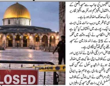
مسجد اقصیٰ کی بندش بیسیویں روز بھی برقرار، صہیونی پابندیوں کی عید تک توسیع

غزہ، قاہرہ اور اسرائیلی اوجڑنے سے مسجد اقصیٰ کی بندش بیسیویں روز بھی برقرار، صہیونی پابندیوں کی عید تک توسیع۔ اس کے علاوہ اسرائیل کو اس کے گیس پلانٹ پر حملے سے روک دیا جائے گا کہ وہ اسرائیل کو اس کے گیس پلانٹ پر حملے سے روک دے۔ اس کے علاوہ اسرائیل کو اس کے گیس پلانٹ پر حملے سے روک دیا جائے گا کہ وہ اسرائیل کو اس کے گیس پلانٹ پر حملے سے روک دے۔