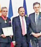
سابق ہندوستانی سفیر جاوید اشرف

سابق ہندوستانی سفیر جاوید اشرف کو ملا فرانس کا اعلیٰ ترین شہری اعزاز دیا گیا ہے۔ اس میں 14 ویں ایڈیشن کے تحت اپریل 2026ء تک خالی اسامیوں کی فہرست جاری کی جائے گی۔ اس میں 14 ویں ایڈیشن کے تحت اپریل 2026ء تک خالی اسامیوں کی فہرست جاری کی جائے گی۔