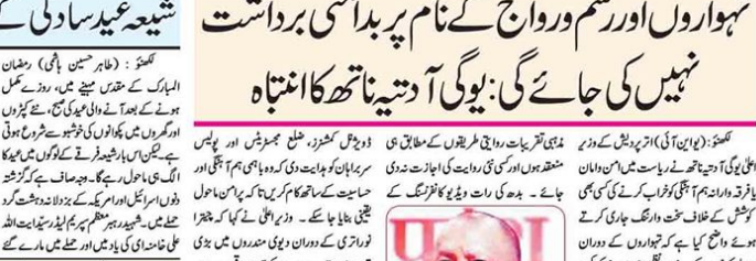
گھنٹہ: یوگی آدتیہ ناتھ نے کہا کہ تہواروں اور رسم و رواج کے نام پر بدامنی برداشت نہیں کی جائے گی۔

تہواروں اور رسم و رواج کے نام پر بدامنی برداشت نہیں کی جائے گی: یوگی آدتیہ ناتھ کا انتہا گھنٹہ: (بی این ایس) اتر پردیش کے وزیر اعلیٰ یوگی آدتیہ ناتھ نے کہا کہ تہواروں اور رسم و رواج کے نام پر بدامنی برداشت نہیں کی جائے گی۔ یوگی آدتیہ ناتھ نے کہا کہ تہواروں اور رسم و رواج کے نام پر بدامنی برداشت نہیں کی جائے گی۔