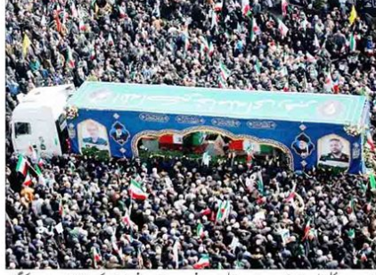
تہران میں علی لاریجانی سمیت دیگر شہداء کی نماز جنازہ میں ہزاروں افراد کی شرکت، فضا سوگ اور غم سے جو جھل رہی

دنیا بھر میں توانائی بحران کا خدشہ، ایران کی فارسی گیس فیولڈ پر اسرائیلی حملے سے گیس کی پیداوار معطل، صہیونی جارحیت کے خلاف ایران کے جوابی حملے تیز: قطر کاسب سے بڑا گیس پلانٹ تباہی کا شکار