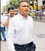
سی بی آئی کے سربراہ

اصل اہمبانی قرض دھوکہ دہی کیس میں سی بی آئی کے سامنے پیش کیا گیا ہے۔ اس میں 14 ویں ایڈیشن کے تحت اپریل 2026ء تک خالی اسامیوں کی فہرست جاری کی جائے گی۔ اس میں 14 ویں ایڈیشن کے تحت اپریل 2026ء تک خالی اسامیوں کی فہرست جاری کی جائے گی۔