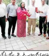
گریٹ نکو بار جزیرے کے قبائلی رہنماؤں

گریٹ نکو بار جزیرے کے قبائلی رہنماؤں کی رائل گاندھی سے ملاقات ہوئی ہے۔ اس میں 14 ویں ایڈیشن کے تحت اپریل 2026ء تک خالی اسامیوں کی فہرست جاری کی جائے گی۔ اس میں 14 ویں ایڈیشن کے تحت اپریل 2026ء تک خالی اسامیوں کی فہرست جاری کی جائے گی۔