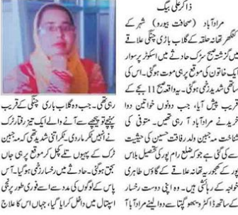
یونی ایس میں منتخبر گیا ٹرک نے اسکوٹی کو ٹکرماری، نرس جاں بحق۔ گلگ بل باڑی چنگی پر حادثہ، ایک خاتون کی حالت تشویشناک۔