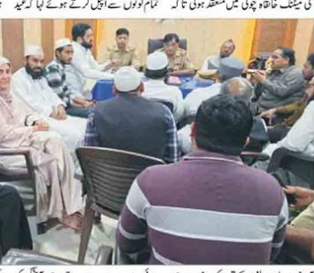
نماز سڑکوں پر نہ پڑھی جائے بلکہ عید گاہ میں ادا کی جائے: کوتوال نچارج۔ عید الفطر کے حوالے سے خاتقاہ چوکی میں شانتی سمیٹی کی میٹنگ۔