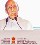
وزیر دفاع راج ناتھ

دہلی (این آئی) وزیر دفاع راج ناتھ نے ہندوستان کی دیسی ڈرون سازی کو عالمی مرکز بنانے کے لیے اپنی حکومت کی پوری صلاحیتوں کو بروئے کار لانا کہا ہے۔ انہوں نے کہا کہ ہندوستان کو عالمی مرکز بنانے کے لیے اپنی حکومت کی پوری صلاحیتوں کو بروئے کار لانا ہے۔ انہوں نے کہا کہ ہندوستان کو عالمی مرکز بنانے کے لیے اپنی حکومت کی پوری صلاحیتوں کو بروئے کار لانا ہے۔