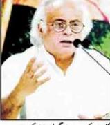
دہلی (این آئی) سیکورٹیز کمیشن کے چیئرمین کی تقریر کے دوران

دہلی (این آئی) سیکورٹیز کمیشن نے اعلیٰ تعمیری ریگولیشن اداروں میں خالی اسامیوں کی نشاندہی کی ہے۔ اس میں 14 ویں ایڈیشن کے تحت اپریل 2026ء تک خالی اسامیوں کی فہرست جاری کی جائے گی۔ اس میں 14 ویں ایڈیشن کے تحت اپریل 2026ء تک خالی اسامیوں کی فہرست جاری کی جائے گی۔ اس میں 14 ویں ایڈیشن کے تحت اپریل 2026ء تک خالی اسامیوں کی فہرست جاری کی جائے گی۔