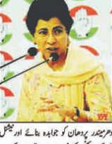
کماری شیلجہ کی تصویر، جنہوں نے نوجوانوں کے مستقبل پر حملہ کا اظہار کیا ہے۔

پندرہ سالہ نوجوانوں کے مستقبل پر حملہ: کماری شیلجہ نے کہا ہے کہ نوجوانوں کے مستقبل پر حملہ ہو رہا ہے۔ کماری شیلجہ نے کہا ہے کہ نوجوانوں کے مستقبل پر حملہ ہو رہا ہے۔ کماری شیلجہ نے کہا ہے کہ نوجوانوں کے مستقبل پر حملہ ہو رہا ہے۔ کماری شیلجہ نے کہا ہے کہ نوجوانوں کے مستقبل پر حملہ ہو رہا ہے۔ کماری شیلجہ نے کہا ہے کہ نوجوانوں کے مستقبل پر حملہ ہو رہا ہے۔