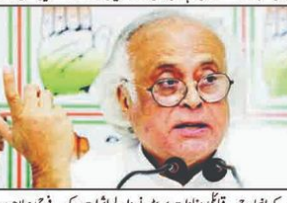
کانگریس کے ایک اہم لیڈر کی تصویر، جنہوں نے گریڈ گلوبار پروجیکٹ پر تشویش کا اظہار کیا ہے۔

نی دہلی (ای این آئی) کانگریس نے گریڈ گلوبار پروجیکٹ کے موجودہ عمل پر تشویش کا اظہار کیا ہے۔ کانگریس نے اس کے خلاف مزید کارروائی کی درخواست کی ہے۔ کانگریس نے اس کے خلاف مزید کارروائی کی درخواست کی ہے۔ کانگریس نے اس کے خلاف مزید کارروائی کی درخواست کی ہے۔ کانگریس نے اس کے خلاف مزید کارروائی کی درخواست کی ہے۔ کانگریس نے اس کے خلاف مزید کارروائی کی درخواست کی ہے۔