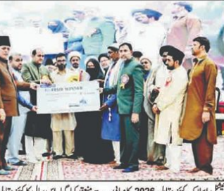
عبادت خانہ حسین، حیدرآباد میں شیعہ نیشنل اسلامک کونٹریکٹ مقابلہ کے افتتاحی تقریب کی تصویر، جس میں شرکاء اور اہلکار شامل ہیں۔

عبادت خانہ حسین، حیدرآباد میں شیعہ نیشنل اسلامک کونٹریکٹ مقابلہ منعقد۔ عبادت خانہ حسین، حیدرآباد میں شیعہ نیشنل اسلامک کونٹریکٹ مقابلہ منعقد۔ عبادت خانہ حسین، حیدرآباد میں شیعہ نیشنل اسلامک کونٹریکٹ مقابلہ منعقد۔ عبادت خانہ حسین، حیدرآباد میں شیعہ نیشنل اسلامک کونٹریکٹ مقابلہ منعقد۔ عبادت خانہ حسین، حیدرآباد میں شیعہ نیشنل اسلامک کونٹریکٹ مقابلہ منعقد۔ عبادت خانہ حسین، حیدرآباد میں شیعہ نیشنل اسلامک کونٹریکٹ مقابلہ منعقد۔