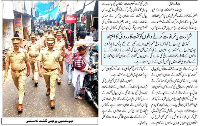
دیوبند میں پولیس گشت کا منظر