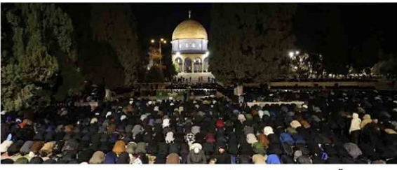
مسجد آسمی کی بندش کے باوجود ولایت القدری بیدار اور قبلادوں میں حاضری کی اہمیت ص: 02

Published from Birmingham (U.K.), India-Delhi, Mumbai, Lucknow, Dehradun Volume No.03, Issue No.245, Monday, 16 March, 2026, 8 Pages جلد نمبر (3)، شمارہ نمبر (245)، بروز پیر 16 مارچ، 2026ء، 26 رمضان المبارک، 1448ھ، صفحات 8