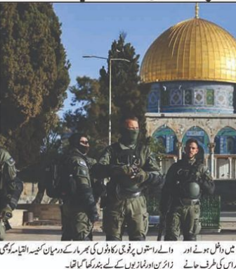
القدس کو فوجی چھاؤنی میں تبدیل کرنا مذہبی اور تاریخی وجود پر سنگین حملہ ہے: حماس۔ تصویر: بیت المقدس کے مقدس مقام ڈومے آف الرک کے قریب۔

القدس کو فوجی چھاؤنی میں تبدیل کرنا مذہبی اور تاریخی وجود پر سنگین حملہ ہے: حماس۔ اسلامی تحریک حماس نے القدس کو فوجی چھاؤنی میں تبدیل کرنا مذہبی اور تاریخی وجود پر سنگین حملہ ہے: حماس۔ اسلامی تحریک حماس نے القدس کو فوجی چھاؤنی میں تبدیل کرنا مذہبی اور تاریخی وجود پر سنگین حملہ ہے: حماس۔