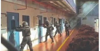
غزہ: اسرائیلی فوجی دستوں نے اسرائیلی فوجی دستوں کے خلاف کارروائی کی۔ اسرائیلی فوجی دستوں نے غزہ کے شمالی علاقوں میں اسرائیلی فوجی دستوں کے خلاف کارروائی کی۔

غزہ: اسرائیلی فوجی دستوں نے اسرائیلی فوجی دستوں کے خلاف کارروائی کی۔ اسرائیلی فوجی دستوں نے غزہ کے شمالی علاقوں میں اسرائیلی فوجی دستوں کے خلاف کارروائی کی۔ اسرائیلی فوجی دستوں نے غزہ کے شمالی علاقوں میں اسرائیلی فوجی دستوں کے خلاف کارروائی کی۔