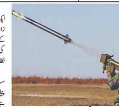
ایک ایرانی فوجی اپنے فوجی سامان کی جانچ کر رہا ہے۔

چین کی دفاعی کمپنیوں نے ایران کو فوضائی دفاعی نظام کی فراہمی کے لیے تیاریاں کر رہی ہیں۔