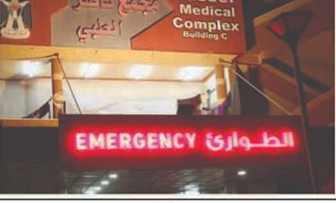
ناصر میڈیکل کمپلیکس کی عمارت۔ تصویر: ناصر میڈیکل کمپلیکس کی عمارت۔

غزہ 21 ہزار سے زائد مریض بیرون ملک علاج کے منتظر، وزارت صحت نے اسرائیلی پروپیگنڈا مسٹر دکرویا۔ غزہ 21 ہزار سے زائد مریض بیرون ملک علاج کے منتظر، وزارت صحت نے اسرائیلی پروپیگنڈا مسٹر دکرویا۔