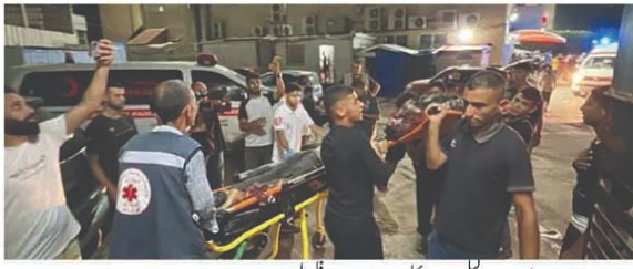
غزہ: اہل رنج اور دیرپا علاج پر اسرا تکلی میساری 8 قلمی شہید