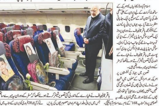
باقر قالیباف نے خطیارے کے عدلیہ کی تصویر پیش کر کے کہا کہ وہاں سے بچوں کی تصاویر اور خون آلود بستے کیساتھ مذاکرات کی میز پر پہنچا۔

ایران کی وزارت خارجہ کے ترجمان کے مطابق، مشہور ماہر اسلام آباد، پاکستان کی قیادت میں پہنچا امریکی وفد، ایران کی قیادت میں پہنچا امریکی وفد کے ساتھ مذاکرات کی میز پر پہنچا۔