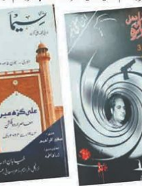
پروفیسر اے ایم جید ایوب کی کتاب 'آخری قسط' کی چھاپی ہوئی تصویر

تقریباً پندرہ اور دو سو سال پہلے انسانی تہذیب نے جنم لیا۔ اس وقت تک انسان نے صرف کھانے پینے اور رہنے کے لیے ضروری چیزیں ہی بنائیں تھیں۔