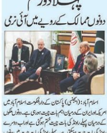
اسلام آباد: پاکستان اور امریکہ کے وفدوں نے مذاکرات ختم کر دیے۔

دو دنوں مذاکرات کے بعد امریکہ اور ایران کے وفدوں نے مذاکرات ختم کر دیے۔