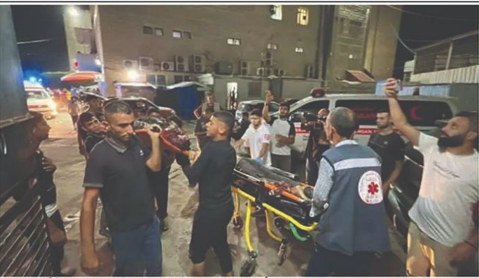
غزہ: البرتج اور دیرالبح پر اسرائیلی بمباری میں 8 فلسطینی شہید۔ تصویر: فوجی دستوں کے ساتھ شہداء کو طبی امداد فراہم کرنے کے لیے لے جانے والے گاڑیوں میں۔

غزہ: حماس فوجی دستوں نے اسرائیلی بمباری کے خلاف غزہ کے شمالی علاقوں میں اسرائیلی فوجی دستوں کے خلاف کارروائی کی۔ اسرائیلی فوجی دستوں نے غزہ کے شمالی علاقوں میں اسرائیلی فوجی دستوں کے خلاف کارروائی کی۔ اسرائیلی فوجی دستوں نے غزہ کے شمالی علاقوں میں اسرائیلی فوجی دستوں کے خلاف کارروائی کی۔