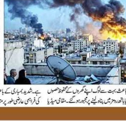
تہران میں دھماکوں کے دھواں

تہران پر امریکہ اور اسرائیل کی شدید بمباری، رات بھر دھماکوں سے گونجتا رہا شہر۔ تہران پر امریکہ اور اسرائیل کی شدید بمباری، رات بھر دھماکوں سے گونجتا رہا شہر۔ تہران پر امریکہ اور اسرائیل کی شدید بمباری، رات بھر دھماکوں سے گونجتا رہا شہر۔ تہران پر امریکہ اور اسرائیل کی شدید بمباری، رات بھر دھماکوں سے گونجتا رہا شہر۔ تہران پر امریکہ اور اسرائیل کی شدید بمباری، رات بھر دھماکوں سے گونجتا رہا شہر۔ تہران پر امریکہ اور اسرائیل کی شدید بمباری، رات بھر دھماکوں سے گونجتا رہا شہر۔