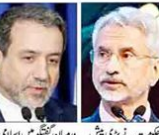
ہندوستان کے وزیر خارجہ

جنگ کے درمیان ہندوستان کا ایران رابطہ۔ جنگ کے درمیان ہندوستان کا ایران رابطہ۔ جنگ کے درمیان ہندوستان کا ایران رابطہ۔ جنگ کے درمیان ہندوستان کا ایران رابطہ۔ جنگ کے درمیان ہندوستان کا ایران رابطہ۔ جنگ کے درمیان ہندوستان کا ایران رابطہ۔ جنگ کے درمیان ہندوستان کا ایران رابطہ۔ جنگ کے درمیان ہندوستان کا ایران رابطہ۔ جنگ کے درمیان ہندوستان کا ایران رابطہ۔