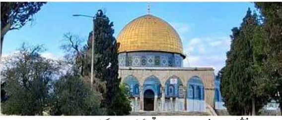
القدس انٹرنیشنل فاؤنڈیشن کارڈن سے مسجد اقصیٰ کو فوری طور پر رکھوانے کا مطالبہ

Published from Birmingham (U.K.), India-Delhi, Mumbai, Lucknow, Dehradun Volume No.03, Issue No.2413, Thursday, 12 March, 2026, 8 Pages جلد نمبر (۳) شمارہ نمبر (۲۴۱۳)، بروز جمعرات، ۱۲ مارچ، ۲۰۲۶ء، ۲۲ رمضان المبارک، ۱۴۴۳ھ صفحات