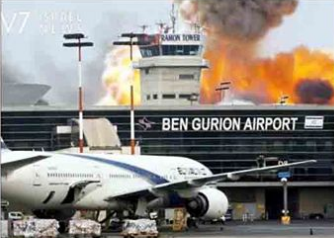
اسرائیلی فوجی طیارہ

ایران کے میزائل اسرائیل کے بن گورین ایئر پورٹ تک پہنچ گئے، صہیونی دفاعی نظام فیل، متعدد اسرائیلی زخمی۔ ایران کے میزائل اسرائیل کے بن گورین ایئر پورٹ تک پہنچ گئے، صہیونی دفاعی نظام فیل، متعدد اسرائیلی زخمی۔ ایران کے میزائل اسرائیل کے بن گورین ایئر پورٹ تک پہنچ گئے، صہیونی دفاعی نظام فیل، متعدد اسرائیلی زخمی۔ ایران کے میزائل اسرائیل کے بن گورین ایئر پورٹ تک پہنچ گئے، صہیونی دفاعی نظام فیل، متعدد اسرائیلی زخمی۔ ایران کے میزائل اسرائیل کے بن گورین ایئر پورٹ تک پہنچ گئے، صہیونی دفاعی نظام فیل، متعدد اسرائیلی زخمی۔ ایران کے میزائل اسرائیل کے بن گورین ایئر پورٹ تک پہنچ گئے، صہیونی دفاعی نظام فیل، متعدد اسرائیلی زخمی۔