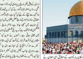
یروشلم میں فلسطینیوں کا مظاہرہ

اندن میں فلسطین کے حق میں نکالے جانے والے القدس مارچ پر پابندی عائد۔ اندن میں فلسطین کے حق میں نکالے جانے والے القدس مارچ پر پابندی عائد۔ اندن میں فلسطین کے حق میں نکالے جانے والے القدس مارچ پر پابندی عائد۔ اندن میں فلسطین کے حق میں نکالے جانے والے القدس مارچ پر پابندی عائد۔ اندن میں فلسطین کے حق میں نکالے جانے والے القدس مارچ پر پابندی عائد۔ اندن میں فلسطین کے حق میں نکالے جانے والے القدس مارچ پر پابندی عائد۔