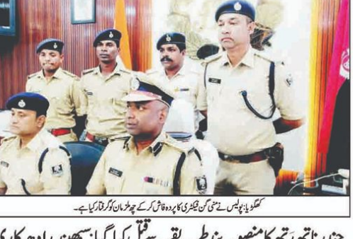
سمبھیر راہویکاری نے کہا کہ چند نارتھ تھرتھ کا منصوبہ بند طریقے سے قتل کیا گیا۔

چند نارتھ تھرتھ کا منصوبہ بند طریقے سے قتل کیا گیا: سمبھیر راہویکاری۔ سمبھیر راہویکاری نے کہا کہ چند نارتھ تھرتھ کا منصوبہ بند طریقے سے قتل کیا گیا۔ سمبھیر راہویکاری نے کہا کہ چند نارتھ تھرتھ کا منصوبہ بند طریقے سے قتل کیا گیا۔