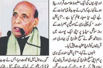
آپریشن سنڈور: تو قومی عزم اور تیاری کی مضبوط علامت: راجناتھ۔

آپریشن سنڈور: تو قومی عزم اور تیاری کی مضبوط علامت: راجناتھ۔ راجناتھ نے کہا کہ آپریشن سنڈور قومی عزم اور تیاری کی مضبوط علامت ہے۔ راجناتھ نے کہا کہ آپریشن سنڈور قومی عزم اور تیاری کی مضبوط علامت ہے۔