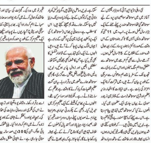
آپریشن سنڈور: مسلح افواج کی کامیابیوں کو خراج تحسین دیا گیا۔

سومنا تھ ہندوستان کے ناقابل تسخیر جذبے کا مظہر: مودی۔ مودی نے کہا کہ ہندوستان کے لوگوں نے ملکر ہندوستان کو بھارت بنایا۔ ہندوستان کے لوگوں نے ملکر ہندوستان کو بھارت بنایا۔ ہندوستان کے لوگوں نے ملکر ہندوستان کو بھارت بنایا۔