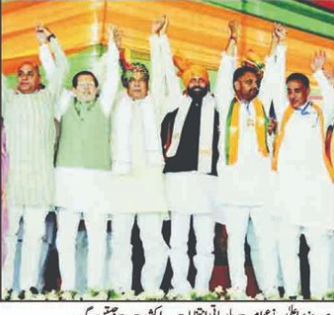
انکڑتے سے بیٹھنے کے دوران سٹی ٹی ایم سے تمام سے بلدیاتی انتخابات کی تیاریاں کیے گئے۔