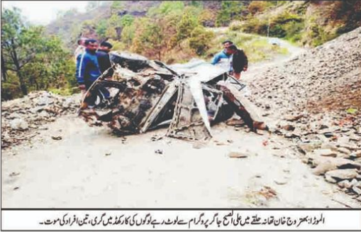
الموڑہ سڑک حادثے میں جاں بحق ہونے والے افراد کی میتوں کی تدفین کے لیے ان کے گھر پر گرام سے لوٹنے والے لوگوں کی ایک کھڑکی میں تدفین کی گئی۔