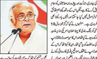
آپریشن سنڈور کے دوران مسلح افواج کی کامیابیوں کو خراج تحسین دیا گیا۔

افغانیہ، ہریانہ، اجمیر میں مسلح گینگوں کی سرکوبی کے لیے آپریشن سنڈور کے دوران مسلح افواج کی کامیابیوں کو خراج تحسین دیا گیا۔ کانگریس پارٹی نے اس عمل کو سراہا اور اس کے ذریعے لوگوں کی جان بچانے میں ہونے والی کامیابیوں کو سراہا۔