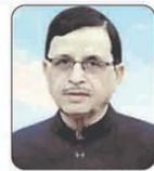
پروفیسر فرتق احمد فارتوقی