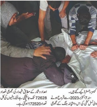
اعداد و شمار کے مطابق شہداء کی مجموعی تعداد 72628 تک پہنچی ہے۔ زخمیوں کی کل تعداد 172520 ہوئی ہے۔