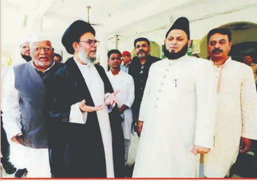
آیت اللہ العظمیٰ علیہ السلام نے وزیر اعلیٰ کے نام پر لکھا گیا ہے۔