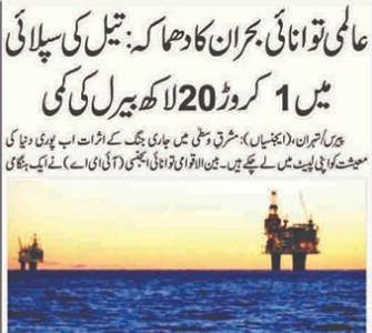
عالمی توانائی بحران کا دھماکہ: تیل کی سپلائی میں 1 کروڑ 20 لاکھ بیرل کی کمی

بیروت (ایس پی سی)۔ بیروت میں رہائشی عمارت پر حملہ کم از کم 5 افراد جاں بحق ہوئے ہیں۔ بیروت میں رہائشی عمارت پر حملہ کم از کم 5 افراد جاں بحق ہوئے ہیں۔ بیروت میں رہائشی عمارت پر حملہ کم از کم 5 افراد جاں بحق ہوئے ہیں۔