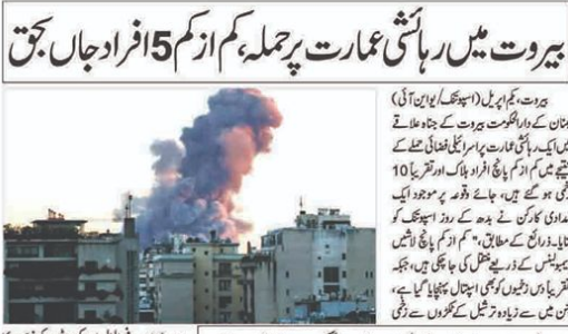
بیروت میں رہائشی عمارت پر حملہ کم از کم 5 افراد جاں بحق ہوئے ہیں۔

بیروت (ایس پی سی)۔ بیروت میں رہائشی عمارت پر حملہ کم از کم 5 افراد جاں بحق ہوئے ہیں۔ بیروت میں رہائشی عمارت پر حملہ کم از کم 5 افراد جاں بحق ہوئے ہیں۔ بیروت میں رہائشی عمارت پر حملہ کم از کم 5 افراد جاں بحق ہوئے ہیں۔