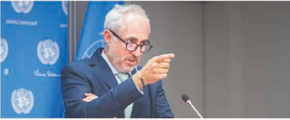
قلمبلی ایران کے لیے سزائے موت کا قانون نسل پرستانہ ہے، اسے واپس لیا جائے: اقوام متحدہ

www.sahafat.in/uk Birmingham Edition U.K.