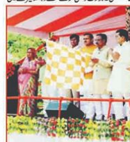
وزیر اعلیٰ نے 250 الیکٹرک و سی این جی گاڑیوں کو دکھائی جھنڈی

لکھنؤ (پنی این ایس) وزیر اعلیٰ نے وزیر اعلیٰ کے نام پر لکھا گیا ہے۔ وزیر اعلیٰ نے کہا کہ اس سال کی تقریبوں کے بعد لکھنؤ کی صفائی کا کام سنبھال دیا جائے گا۔ وزیر اعلیٰ نے کہا کہ اس سال کی تقریبوں کے بعد لکھنؤ کی صفائی کا کام سنبھال دیا جائے گا۔ وزیر اعلیٰ نے کہا کہ اس سال کی تقریبوں کے بعد لکھنؤ کی صفائی کا کام سنبھال دیا جائے گا۔