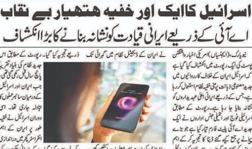
اسرائیل کا ایک اور خبیث ہتھیار بے نقاب آئے کی ذریعے ایرانی قیادت کو نشانہ بنانے کا بڑا انکشاف

بیروت (ایس پی سی)۔ بیروت میں رہائشی عمارت پر حملہ کم از کم 5 افراد جاں بحق ہوئے ہیں۔ بیروت میں رہائشی عمارت پر حملہ کم از کم 5 افراد جاں بحق ہوئے ہیں۔